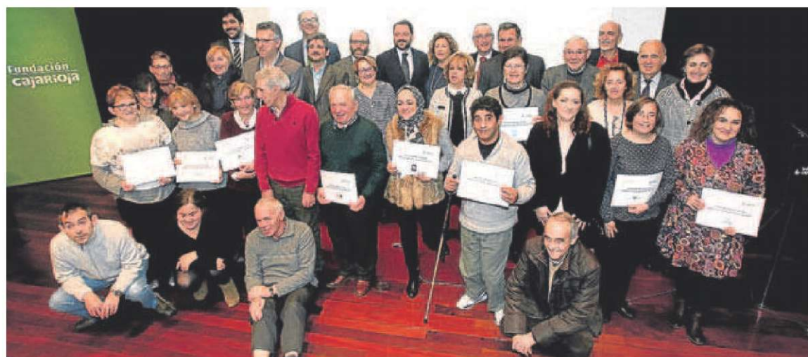
Los representantes de las entidades beneficiadas por la Fundación Caja Rioja.

Durante la competición, 450 jóvenes europeos de hasta 25 años medirán sus habilidades y capacidades para resolver diferentes pruebas relacionadas con su profesión, en 35 modalidades distintas. El objetivo de esta iniciativa, que se celebra cada dos años, es mejorar la calidad y la imagen de la FP en Europa, además de servir como punto de encuentro entre alumnos, profesores, empresas y administración relacionados con este nivel formativo, y un foro en el que intercambiar ideas y experiencias.