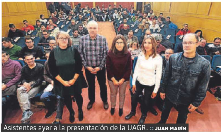
Asistentes ayer a la presentación de la UAGR.

La UAGR-COAG presentó ayer Geotrazza, una aplicación para el móvil con la que rellenar automáticamente en el Cuaderno de Explotación los tratamientos fitosanitarios aplicados a los cultivos. Más de cien agricultores de toda La Rioja asistieron ayer en el Centro Cultural de Ibercaja al acto.